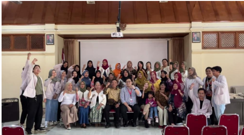
Gambar 5. Foto Bersama