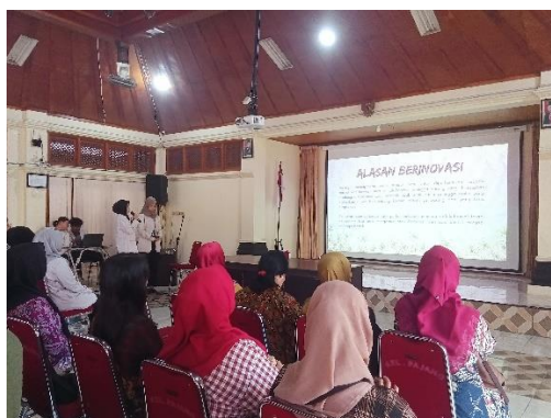
Gambar 2. Pemaparan Materi Inovasi Produk

Banyak faktor yang menentukan keberhasilan bersaing, salah satunya adalah melalui inovasi produk. Inovasi produk akan menghasilkan berbagai desain produk sehingga akan meningkatkan pilihan produk dan manfaat atau nilai yang diterima oleh pelanggan (Hills dalam Noviani, 2020). Sebelumnya, usaha Ecoprint KWT Pandan Arum 48 Kjang ini memproduksi hanya dalam bentuk kain dan tas kecil. Oleh karena itu, kami berupaya untuk memberikan pemahaman tentang pentingnya berinovasi. Selain itu, kami juga memberikan contoh produk inovasi yang dapat diterapkan dalam usaha Batik