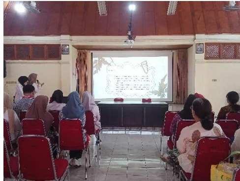
Gambar 3. Pemaparan Materi Pengolahan Limbah Ecoprint

Dalam suatu usaha, perlu memperhatikan apakah usaha yang dijalankan menghasilkan limbah yang berbahaya dan dampaknya pada lingkungan sekitar. Oleh karena itu, kami berupaya untuk kami memberikan pemahaman pentingnya mengelola limbah dan bagaimana cara pengolahan limbah yang tepat baik limbah padat maupun limbah cair. Dalam Ecoprint KWT Pandan Arum 48 Kjang, limbah padat dapat dijadikan sebagai media tanam dan makanan ternak melalui proses pengomposan. Sedangkan limbahnya dapat digunakan kembali sebagai pewarna alami selama warna cairan tersebut masih pekat. Sehingga, dengan adanya sosialisasi ini diharapkan dapat meningkatkan kesadaran pelaku usaha Ecoprint KWT Pandan Arum 48 Kjang terhadap lingkungan serta mengetahui bagaimana cara mengolah limbah yang tepat.