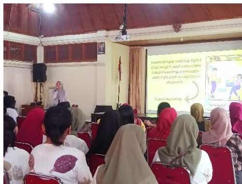
Gambar 4. Pemaparan Materi Digital Marketing

Perkembangan ilmu dan teknologi yang semakin canggih menciptakan adanya e-commerce yaitu aktivitas jual beli secara elektronik, sehingga membuat pelaku usaha harus mampu beradaptasi. Semua berubah menjadi serba digital , mulai dari strategi pemasaran hingga pembayaran melalui digital . Oleh karena itu, kami berupaya untuk memberikan pemahaman tentang bagaimana pemanfaatan teknologi digital dalam dunia bisnis yaitu digital marketing seperti e-commerce , marketplace , dan media sosial. Digital marketing memungkinkan pembeli mendapatkan informasi mengenai suatu produk baik berupa barang atau jasa melalui internet, sehingga penjual dapat berinteraksi dengan calon pembeli dimana saja dan kapan saja (Diansyah dkk dalam Abdurrahman et al. , 2020). Sehingga, diharapkan dapat meningkatkan pemahaman tentang potensi dan manfaat digital marketing dalam memperluas jangkauan pasar dan meningkatkan awareness Ecoprint KWT Pandan Arum 48 Kjang.