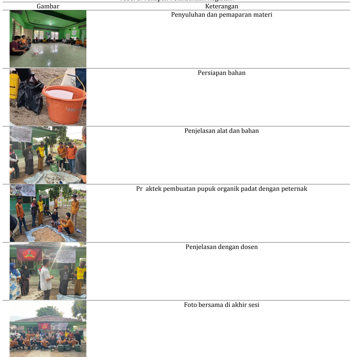
Tabel 2. Tahapan Pelaksanaan Kegiatan

Selanjutnya adalah pemaparan prosedur oleh tim PPK Ormawa yang diikuti praktik oleh peternak. Berikut adalah tahap pembuatan pupuk organik padat yang didokumentasikan oleh Tim PPK Ormawa HIMAPROSTER 2024.