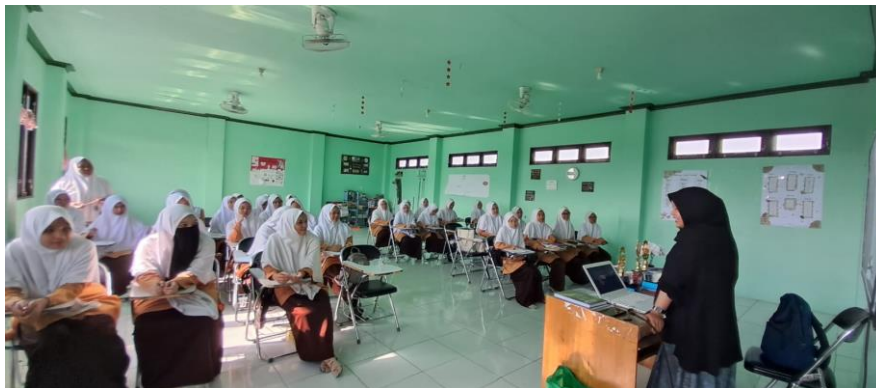
Gambar 1. Dokumentasi pelaksanaan kegiatan bedah sastra pesantren karya santriwati MAS NIPI Ponpes Rasyidiyah Khalidiyah

Diharapkan dengan memahami teknik menulis cerita pendek, para santriwati dapat mengatasi kendala-kendala yang mereka alami. Chen (dalam Djuaini & Arisandi, 2023) menyebutkan beberapa kendala yang sering dialami santri dalam menulis, seperti kurangnya kosakata yang dikuasai, kesulitan memilih diksi, keterbatasan dalam menggunakan struktur bahasa yang baik, serta kesulitan mencari alternatif kalimat. Kendala-kendala tersebut dapat menjadi hambatan besar dalam menuangkan gagasan mereka ke dalam tulisan.