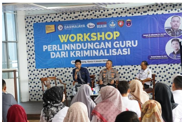
Gambar 3. Pemaparan Materi

Dukungan penuh Polri kepada organisasi Dewan Kehormatan Guru Indonesia yang dengan kewenangan untuk memeriksa dan menetapkan pelanggaran kode etik yang dilakukan oleh guru dalam melaksanakan tugas profesinya. Penyidikan tindak pidana yang dilakukan terhadap guru, tetap berdasar kepada azas praduga tak bersalah. Guru tidak mempunyai hak istimewa namun upaya paksa terhadap guru, tidak dilakukan dalam proses pembelajaran. Kecuali patut diduga terdapat barang bukti yang ada padanya terhadap tindak pidana tertentu misalnya narkoba dan atau tindak pidana yang dapat membahayakan keselamatan jiwanya. Upaya paksa yang dilakukan oleh Polri memperhatikan etika, situasi, dan sosial hukum dalam rangka memberikan perlindungan profesi dan keamanan guru. Berkaitan dengan perbuatan tindak pidana yang tidak disengaja dan perbuatan yang rawan timbulnya tindak pidana yang berkaitan dengan profesi, proses penyelesaian hukumnya diutamakan dengan perdamaian, dalam rangka menjaga kewibawaan guru dengan tidak menyalahi dan tetap berdasarkan peraturan perundang-undangan yang berlaku.