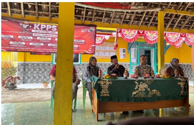
Gambar 2. Rapat perencanaan pembangunan Perpustakaan Desa