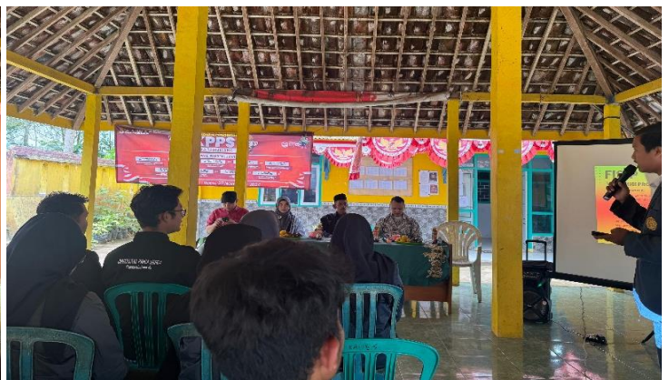
Gambar 3. Rapat perencanaan pembangunan Perpustakaan Desa

Pengumpulan data dalam program pengabdian masyarakat ini dilakukan melalui tiga teknik utama, yaitu observasi, wawancara, dan dokumentasi. Teknik observasi digunakan untuk memantau langsung kondisi lapangan, termasuk perilaku masyarakat dan interaksi mereka dengan kegiatan yang dilaksanakan. Selain itu, wawancara dilakukan dengan berbagai pihak terkait, seperti pemuda desa, tokoh masyarakat, dan pengelola perpustakaan, untuk menggali informasi lebih dalam mengenai kebutuhan, persepsi, dan harapan mereka terhadap program pengabdian ini. Dokumentasi dilakukan dengan mencatat seluruh proses kegiatan, termasuk foto, notulen rapat, dan dokumen perencanaan, sebagai bukti dan referensi evaluasi. Data yang terkumpul kemudian dianalisis secara deskriptif untuk menggambarkan secara mendalam proses dan hasil yang dicapai dari program ini. Dengan pendekatan ini, diharapkan dapat diperoleh gambaran yang lebih jelas mengenai keberhasilan program serta dampaknya terhadap peningkatan literasi di Desa Tambelang. Proses analisis ini juga membantu dalam merencanakan tindak lanjut dan pengembangan program di masa yang akan datang (Kurniawan, 2022).