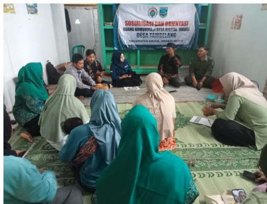
Gambar 4. Rapat perencanaan pembukaan Perpustakaan Desa

Keberhasilan program ini tidak hanya terlihat dari aspek fisik perpustakaan, tetapi juga dari terbentuknya komunitas literasi yang aktif di kalangan pemuda desa. Perpustakaan telah menjadi pusat aktivitas pembelajaran yang mendorong peningkatan pengetahuan dan wawasan pemuda desa. Program-program unggulan seperti "Sabtu Literasi", "Bedah Buku Bulanan", dan "Festival Literasi Desa" berhasil menarik partisipasi pemuda dan menciptakan dampak positif bagi perkembangan literasi di desa. Data menunjukkan bahwa 60% pemuda desa telah terdaftar sebagai anggota perpustakaan aktif. Program pembangunan perpustakaan desa ini dapat menjadi model pengembangan literasi di daerah pedesaan lainnya. Beberapa faktor kunci keberhasilan program ini meliputi: dukungan penuh dari pemerintah desa, partisipasi aktif pemuda dalam pengelolaan, program-program kreatif yang menarik minat pembaca, dan kolaborasi dengan berbagai pemangku kepentingan. Pengalaman di Desa Tambelang menunjukkan bahwa dengan pendekatan yang tepat dan dukungan yang memadai, perpustakaan desa dapat menjadi katalis perubahan dalam meningkatkan budaya literasi masyarakat pedesaan.