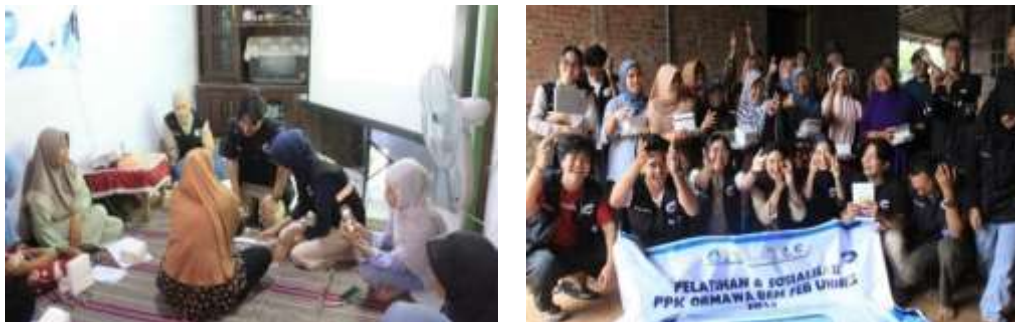
Gambar 3 Praktik Pengemasan