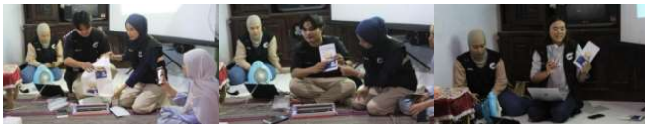
Gambar 2 Sosialisasi Pengemasan dan Pemasaran

Evaluasi peningkatan pengetahuan dan keterampilan dilakukan dengan pre-test dan post-test sederhana. Hasil evaluasi menunjukkan adanya peningkatan pada Sosialisasi Pengemasan dari 46,80 menjadi 62,40 dan pada Sosialisasi Pemasaran dari 54,00 menjadi 65,60 setelah pelatihan atau meningkat sebesar 39 poin persentase. Sebanyak 25 orang dari 30 peserta dapat mengemas ulang produknya sesuai standar higienis dan estetika yang diajarkan. Kemasan yang dihasilkan lebih kuat, bersih, awet serta dilengkapi label produk berisi nama komposisi dan tanggal produksi. Selain itu ada perubahan perilaku peserta yang mulai memahami pentingnya inovasi serta menjaga kualitas produk sebagai strategi bersaing di pasar. Dampak sosial dan ekonomi kegiatan ini juga sangat positif. Berdasarkan hasil wawancara pasca-kegiatan, peserta merasa lebih termotivasi untuk mengembangkan usaha pengolahan hasil laut secara mandiri serta memasarkan produknya secara daring melalui media sosial dan jaringan komunitas lokal. Seluruh rangkaian kegiatan didokumentasikan secara sistematis melalui dokumentasi kegiatan. Catatan pelaksanaan menunjukkan bahwa program